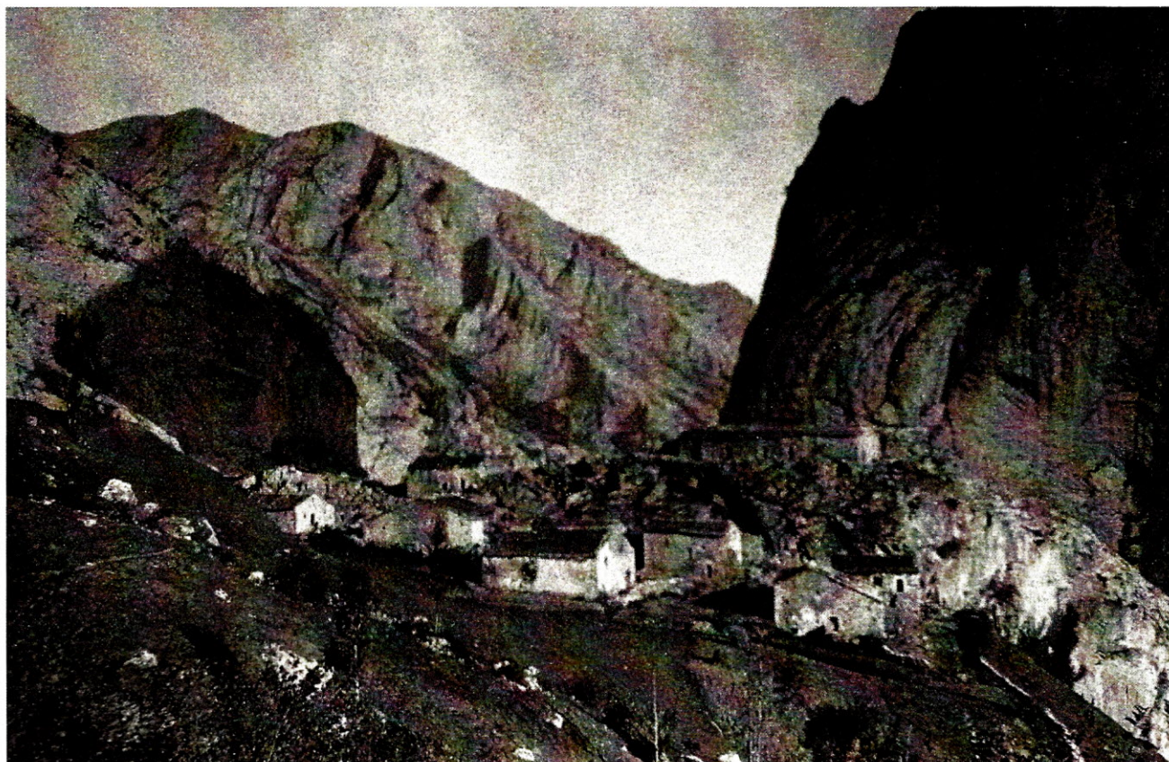
1906. Barrio del Castillo