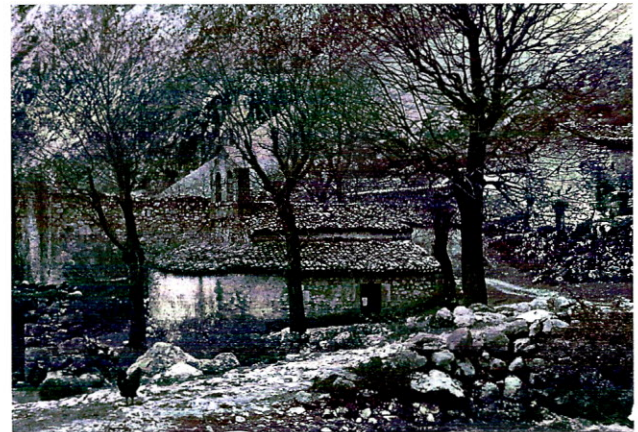
Vista del río y la iglesia de La Villa en los años 60. A la izquierda, los muros, ya sin techo, de la Rectoral

Todas las fotos de esta página son de los años 60