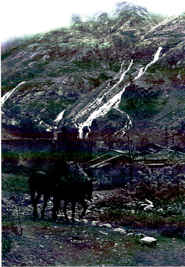
Proximidades del barrio de La Villa. Obsérvense las caudalosas surgencias, evidencia de fuertes lluvias o deshielo en los días anteriores