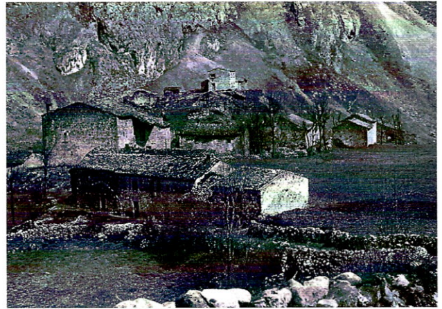
Barrio de El Castillo. La casa alargada al lado del camino fue escuela durante un tiempo