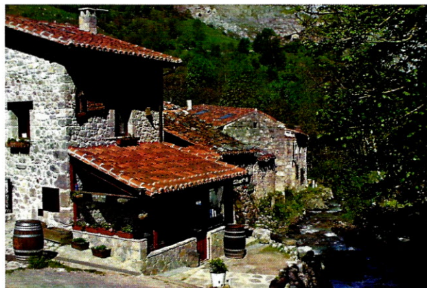
Un rincón del Bulnes actual

La caravana de los Reyes de 1960 gozó de una cober-