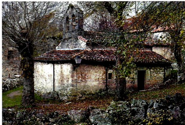
La iglesia de La Villa en la actualidad

llegar al corazón del Macizo Central; en particular, al Picu y al Torrecerredo, metas máximas del escalador y el montañero.