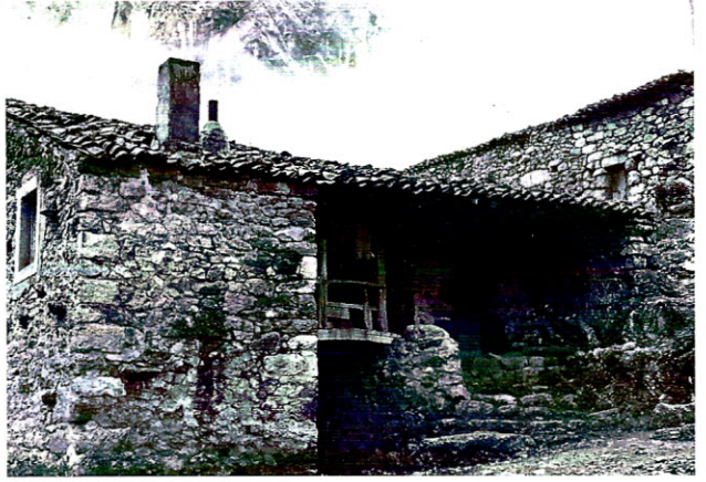
La casa de Esteban Mier en el barrio de El Castillo